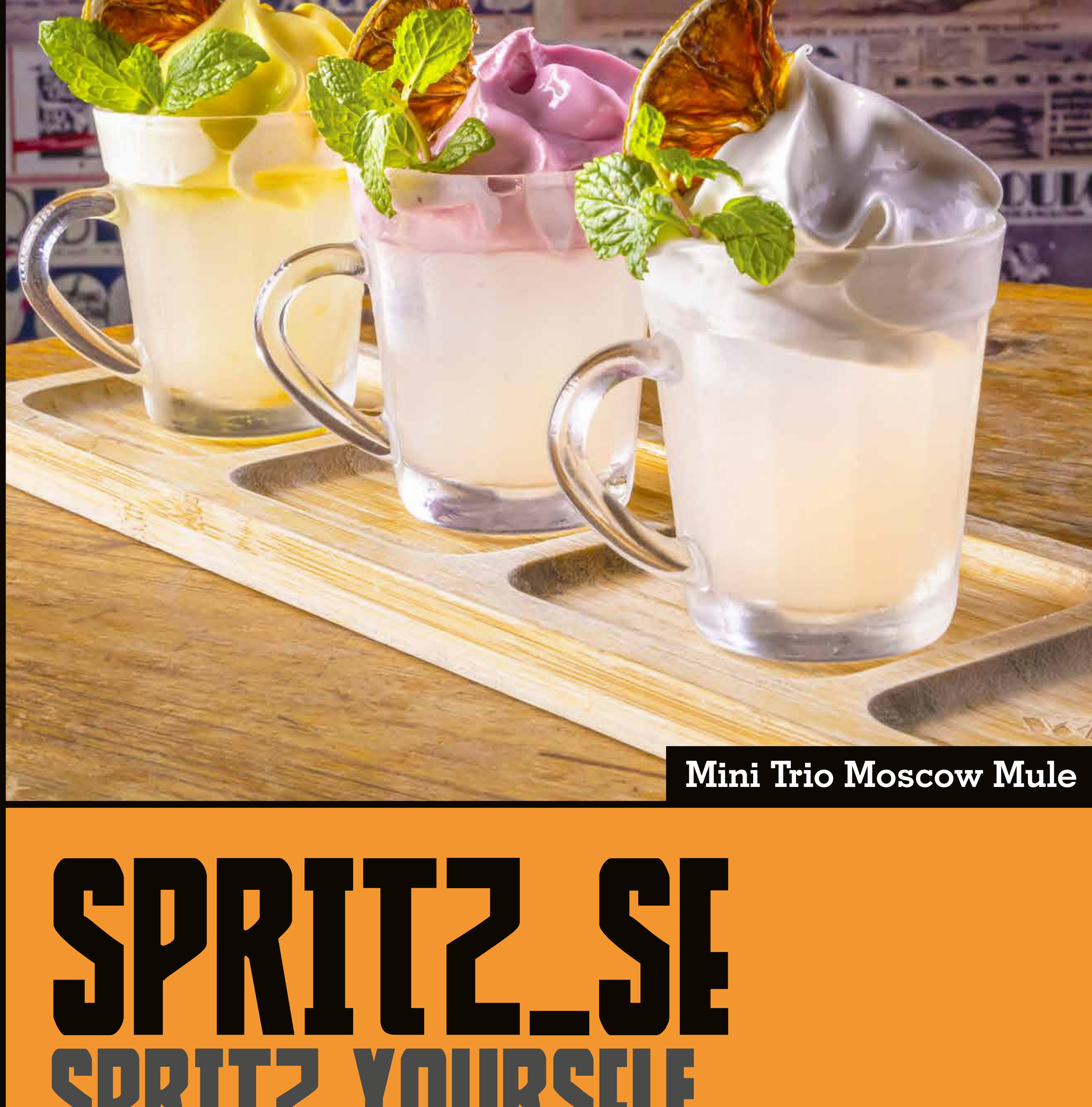
Mini Trio Moscow Mule