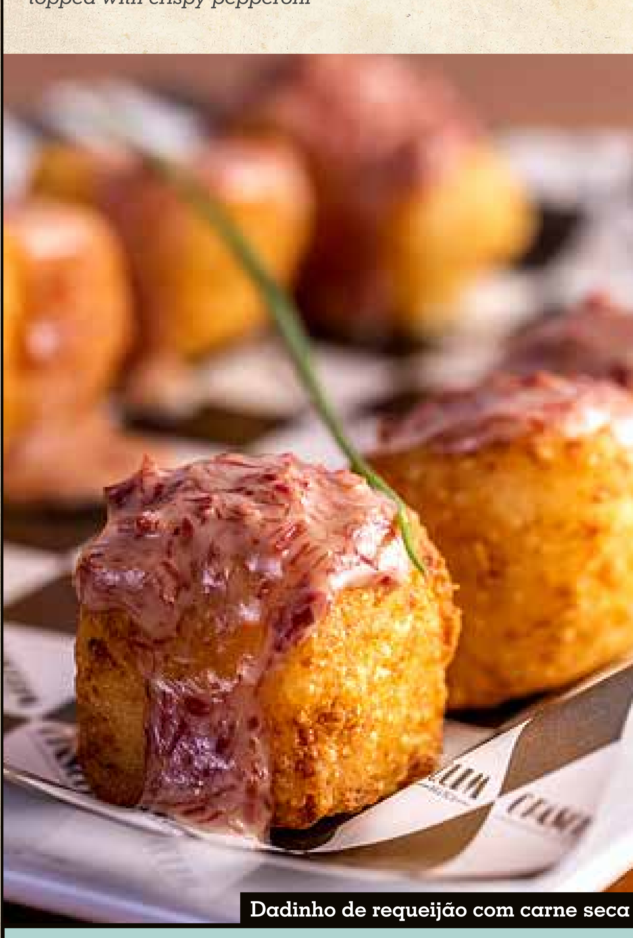
Dadinho de requeijão com carne seca