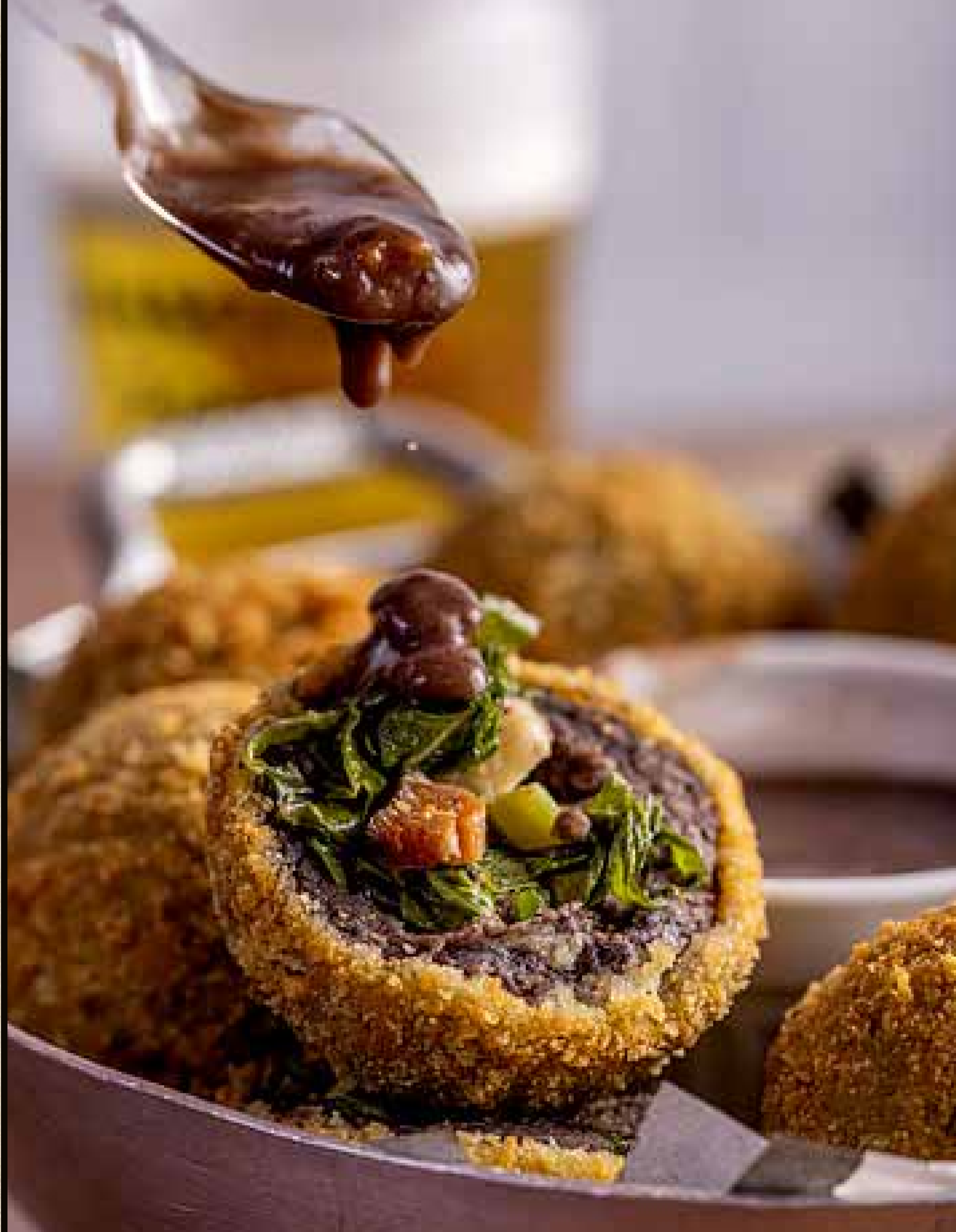
Bolinho de feijoada