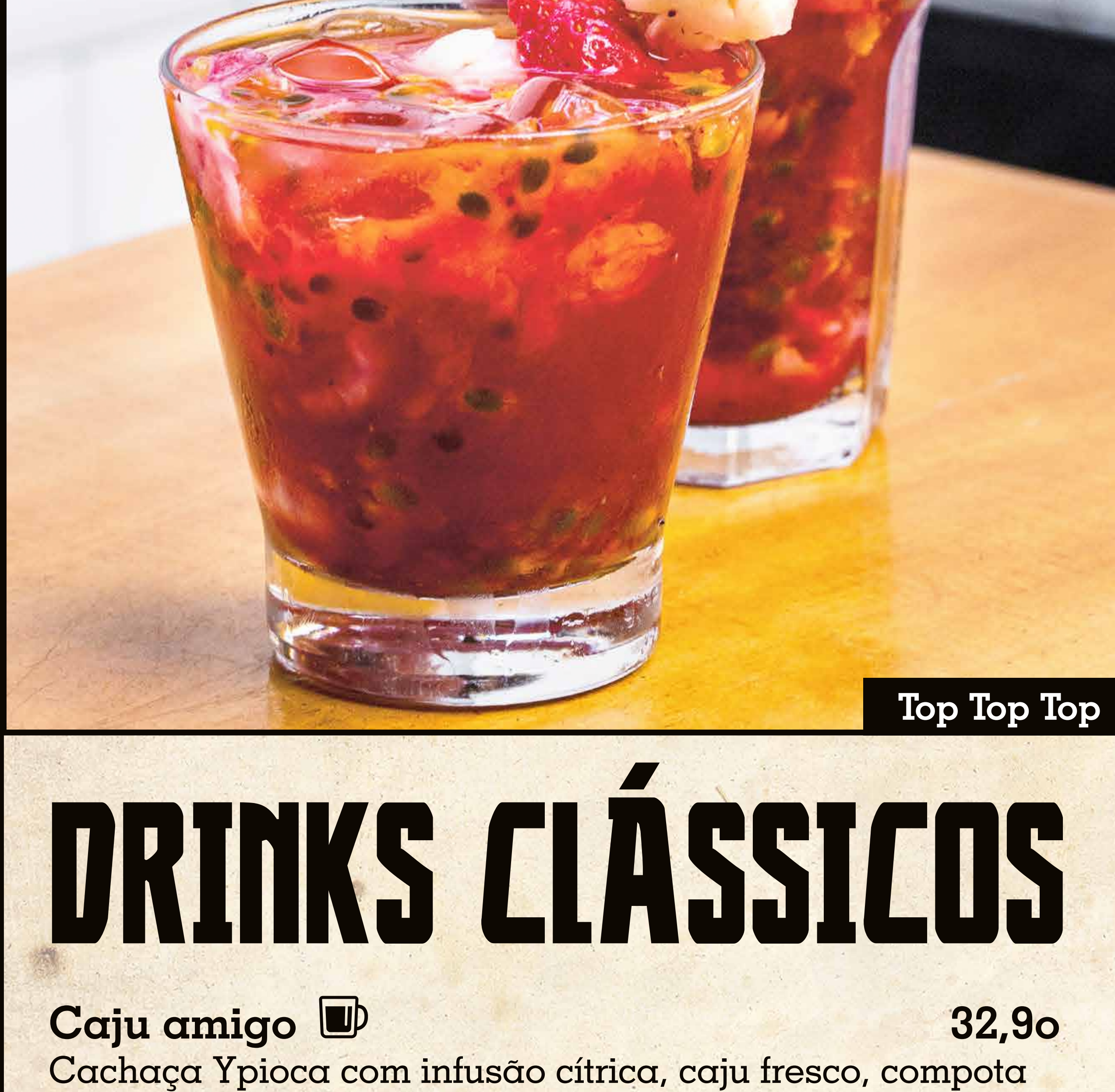
Top Top Top

Seasonal fruits (check with the waitress to see what is available)